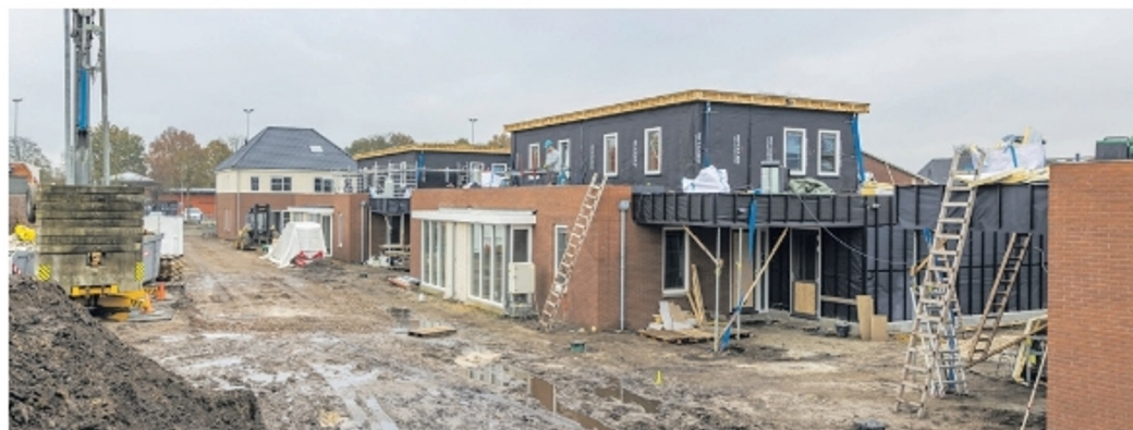
Vanaf vrijdag 1 december 2023 kunt u subsidie voor een nieuwbouwproject aanvragen.

Neem contact op met Nienke Hemeltjen van de afdeling Ruimte & Economie. Dat kan op werkdagen via telefoonnummer (0544) 39 34 99 of n.hemeltjen@oostgelre.nl .